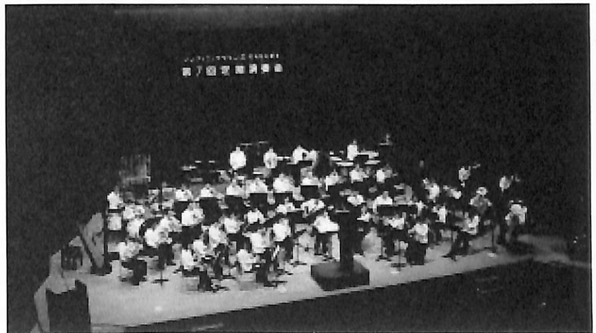
シンフォニックウインズKAGAWA

秋に行う定期演奏会の他、イベント演奏や訪問演奏などで、より多くの方に吹奏楽を楽しんで頂けるよう音楽を楽しみながら練習に励んでいます。中編成ではありますが、編成的にはチョット無謀とも思える大曲に毎年挑んでいます。コンクール・バンドではありませんので、良い意味で減点を気にしない、伸び伸びとした演奏を心がけています。